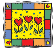
Gemenskap i Kungsör

På Mötesplats Tallåsgården är du som är 65+ välkommen att delta i olika aktiviteter eller bara komma och umgås i härligt sällskap.