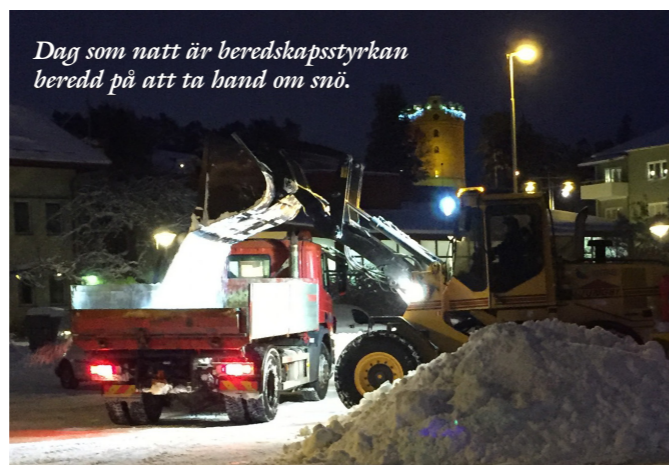
Dag som natt är beredskapsstyrkan beredd på att ta hand om snö.

För att avgöra när insatser ska ske finns ett speciellt