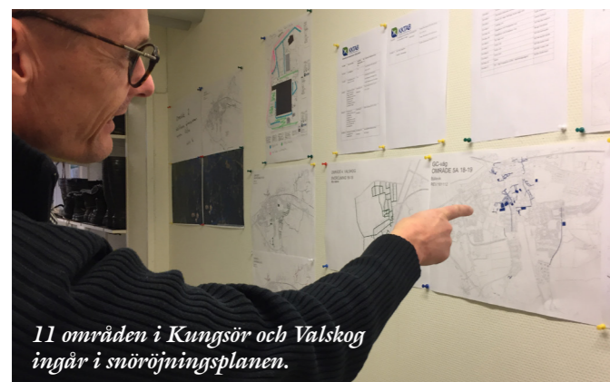
11 områden i Kungsör och Valskog ingår i snöröjningsplanen.

Undvik det som drar mycket el, som elburen golvvärme, bastu och torktumlare. Om golvvärme är på, välj samma temperatur som resten av huset.