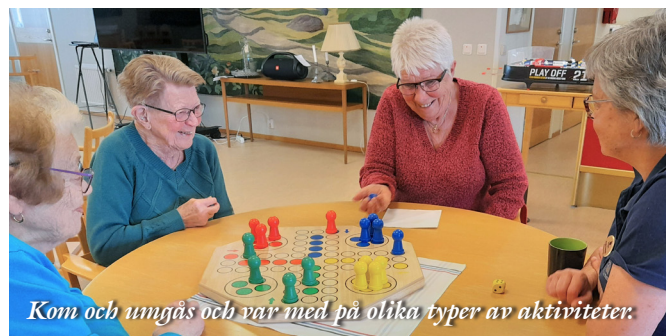
Kom och umgås och var med på olika typer av aktiviteter.

Måndagsträffar börjar med balansgympa och därefter ett tema för dagen, så som konst, brädspel, gamla föremål med mera. Nyligen startades en satsning på balans och styrka med enkla övningar som även går att göra hemma.